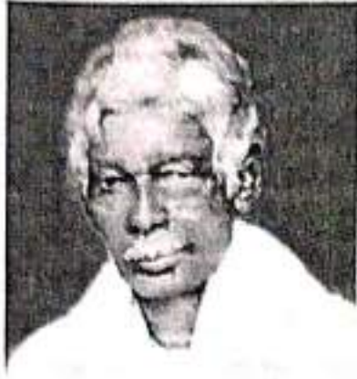
PANDIT RAGHUNATH MURMU (D. Lit in Santali, 5.5.1905 - 1.2.1982)